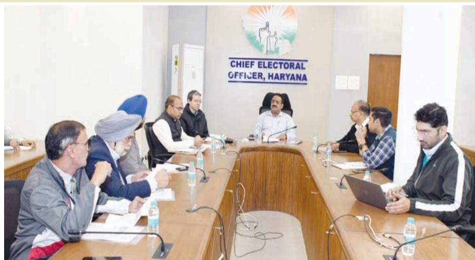
दल बूथ लेवल एजेंटों की जानकारी मुख्य निर्वाचन अधिकारी कार्यालय में भिजवाना सुनिश्चित करें। इसके अतिरिक्त राजनीतिक दल जिलों में एक या दो व्यक्तियों को अधिकृत

करवाएं और इसका रिकार्ड भी सुरक्षित रखें। उन्होंने कहा कि हरियाणा 6 राष्ट्रीय स्तर तथा दो राज्य स्तरीय मान्यता प्राप्त राजनीतिक दल हैं। सभी दलों को बूथ लेवल एजेंट 1 और 2 की नियुक्ति करनी है। राजनीतिक दलों के लिए बूथ लेवल एजेंट एक प्राथिकृत व्यक्ति है जो मतदान से संबंधित सामग्री अपनी पार्टी के लिए चुनाव आयोग से लेता है। उन्होंने कहा कि त्रुटि रहित मतदान सूची तैयार करने में बीएलओ को मतदाताओं के संबंध में आवश्यक जानकारी बूथ लेवल एजेंट उपलब्ध करवाता है। उन्होंने कहा कि वर्ष 2008 में बूथ लेवल एजेंट की नियुक्ति करने की चुनाव आयोग ने सिफारिश की थी, लेकिन अधिकांश राजनीतिक दल इसके प्रति गंभीर नहीं हैं। उन्होंने कहा कि 3 मार्च 2025 तक सभी राजनीतिक