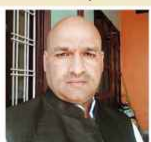
पालिका के प्रधान व पार्षदों के