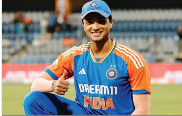
राशिद के हाथों हार के बाद फिर से नंबर 1 गेंदबाज का स्थान हासिल कर लिया है।

हार्दिक पांड्या ( पांच पायदान ऊपर 51वें स्थान पर) और शिवम दुबे (38 पायदान ऊपर 58वें स्थान पर) भी इंग्लैंड के खिलाफ कुछ अच्छे स्कोर के बाद टी20आई बल्लेबाजों की रैंकिंग में बड़ी छलांग लगाते हैं। टी20आई गेंदबाजों की ताजा रैंकिंग में भी यही कहानी है। स्पिनर वरुण चक्रवर्ती 14 विकेट (एक पांच विकेट सहित) और जोस बटलर की टीम के खिलाफ प्लेयर ऑफ द सीरीज की बढौलत तीन पायदान ऊपर चढ़कर दूसरे स्थान पर पहुंच गए हैं। टीम के साथी रवि बिश्नोई (चार पायदान ऊपर छठे स्थान पर) भी इंग्लैंड के खिलाफ सीरीज में पांच विकेट लेने के बाद टी20आई गेंदबाजों की सूची में ऊपर आए हैं। शीर्ष पर एक और बदलाव हुआ है, वेस्टइंडीज के स्पिनर अक्रील होसेन ने एक सप्ताह पहले आदिल