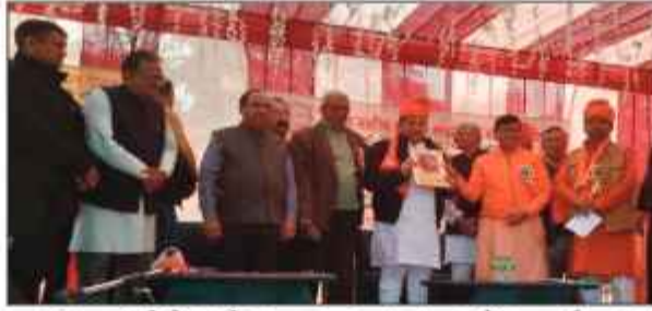
स्वामी श्रद्धानंद ने देश और समाज को जीवन पर्यंत संगठित करने का कार्य किया। आज भी आर्य समाज उनके पदचिन्हों पर चलकर देशहित में लगा है। इससे पूर्व कार्यक्रम स्थल पर यज्ञ का आयोजन किया गया

फरीदाबाद। आर्य समाज का देश की आजादी में महत्वपूर्ण भूमिका रही है। आर्य समाज के जांबाजों ने फिरंगी सरकार से लोहा लेते हुए देश के लिए अपनी कुर्बानियां दी है। जिसका देश हमेशा उनका ऋणी रहेगा। यह बात केबिनेट मंत्री विपुल गोयल ने स्वामी श्रद्धानंद बलिदान दिवस पर आर्य केंद्रीय सभा द्वारा निकाली गई शोभायात्रा को सेक्टर-16 से शुभारंभ करते हुए कही। उन्होंने कहा कि आज भी आर्य समाज के कार्यकर्ता देश की उन्नति और परोपकार के कार्यों में लगे हैं।