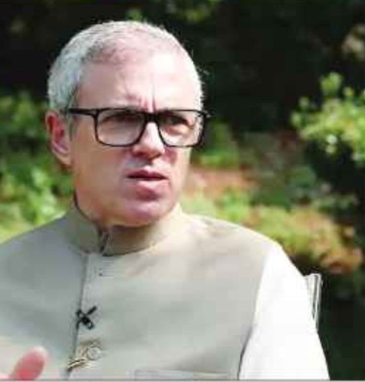
प्रदेश जम्मू-कश्मीर और लद्दाख में बांट दिया गया था। उमर अब्दुल ने दिल्ली का

नई दिल्ली (एजेंसी)। सीएम उमर अब्दुल ने कहा कि जम्मू-कश्मीर में लेफ्टिनेंट गवर्नर के साथ सत्ता शेरार करना विनाश की रेसिपी की तरह है। उन्होंने कहा कि डबल पावर सेंटर सिस्टम कभी काम नहीं करेगा। उमर ने यह बात एक साक्षात्कार में कही। सीएम उमर ने कहा कि मैं बस इतना कहना चाहता हूँ कि किसी भी जगह डबल पावर सेंटर होना आपदा का कारण बन सकता है। अगर कई पावर सेंटर हैं तो कोई भी संगठन ठीक से काम नहीं कर सकता है। यही कारण है कि हमारी खेल टीम में एक कप्तान होता है, दो नहीं। उमर ने केंद्र सरकार से अपना वादा निभाने की बात भी कही। उन्होंने कहा कि जल्द जम्मू-कश्मीर का राज्य का दर्जा बहाल किया जाए। केंद्र सरकार ने 5 अगस्त 2019 को जम्मू-कश्मीर के स्पेशल स्टेट्स को खत्म कर दिया था। इस दौरान इसे दो केंद्र शासित