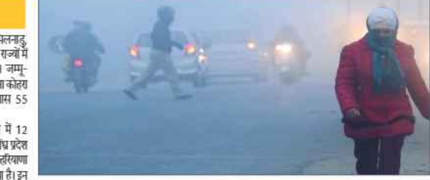
18 दिसंबर की रात को तमिलनाडु, पुदुचेरी, कर्नाटक, आंध्र प्रदेश के अलावा केरल में बिजली गिरने के साथ बारिश के आसार हैं। राजस्थान के कुछ इलाकों में शीतलहर चलेगी। तापमान में बहोते ही की उम्मीद नहीं है। नॉर्थ ईस्ट के राज्यों में भी ठंड बढ़ सकती है। यहाँ तापमान के गिरावट आ सकती है।

मौसम विभाग के मुताबिक सोमवार को तमिलनाडु, पुदुचेरी में 7 सेंटीमीटर से ज्यादा बारिश होगी। इन राज्यों में बिजली गिरने का भी अनुमान लगाया गया है। जम्मू-कश्मीर, लद्दाख, राजस्थान और मध्य प्रदेश में घना कोहर छाया होगा। पश्चिम बंगाल के तटीय आसमान 55 किलोमीटर प्रति घंटे की रफ्तार से हवा चलेगी। वहीं 17 दिसंबर को तमिलनाडु, पुदुचेरी में 12 सेंटीमीटर से ज्यादा बारिश होगी कर्नाटक और आंध्र प्रदेश में 7 सेंटीमीटर से ज्यादा बारिश हो सकती है। हरियाणा और यूपी में घने कोहरे का अलर्ट जारी किया गया है। इन राज्यों में विजिबिलिटी भी घट सकती है। राजस्थान में माइनस 4.0, तुलनाम में माइनस 3.8 डिग्री तापमान पांच डिग्री से नीचे रहने की उम्मीद है।