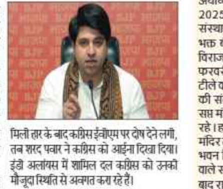
फिलीप को बाद कांग्रेस इंडीएम पर दोष देने लगी, तब सार पवार ने कांग्रेस को आईना दिखा दिया। इंडी अलायंस में शामिल दल कांग्रेस को उनकी मौजूदगी स्थिति से अक्लत कर रहे हैं।

भाजपा नेता ने तंज कसा, इतना ही नहीं अब तो लेफ्ट भी यही बात कर रही है कांग्रेस ने नहीं हो पा रहा है। कांग्रेस पार्टी इंडी गठबंधन में एक मौम बन चुकी है। पहले परनेवो का मौम बनती थी। अब इंडी के सभी लोग कर रहे हैं कांग्रेस नहीं हो पाएगा। कांग्रेस हारी हुई पार्टी है। राहुल गांधी के नेतृत्व में 90 चुनाव हार चुकी है। इंडी अलायंस में अब कांग्रेस को कोई बदोश करने के मुद्दे में नहीं है। झारखंड में कांग्रेस को डिप्टी सीएम पद देने दे रहे हैं। भाजपा ने कहा, झारखंड में कांग्रेस को नेता बनाया जाए, तब हम उस मांग का स्वागत करते हैं।