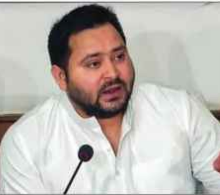
लगातार छात्रों के भविष्य के साथ खिलवाड़ हो रहा है। तेजस्वी ने पूछा कि मुख्यमंत्री बताएं कि

पटना (एजेंसी)। बीजेपीएससी अध्यापकों पर हुए लाठीचार्ज को रजद नेला और पूर्व उपमुख्यमंत्री तेजस्वी यादव ने छात्रों के भविष्य संग खिलवाड़ बताया है। तेजस्वी के मूलांक बिहार में अफसरशाही चरम पर है। प्रदेश के पूर्व डिप्टी सीएम ने कहा, देखिए लाठीचार्ज हुआ है और यह लाठी डंडे वाली सरकार है। अफसरशाही पूरे चरम पर है। मुख्यमंत्री नीतीश कुमार तेष में नहीं हैं। नहीं जानते बिहार में क्या हो रहा है। सच यह है कि चाचा नीतीश से बिहार चल नहीं पा रहा है।