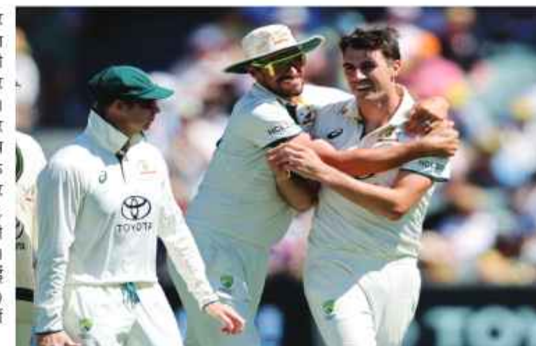
पेवेलियन लौट गये। इस प्रकार 128 के स्कोर पर भारतीय टीम का छठ विकेट गिरा। नीतीश ने पहली पारी को तरह ही दूसरी पारी में भी सबसे अधिक 42 रन बनाए और किसी प्रकार भारतीय टीम को ने 166 रन तक पहुंचाया। इसके बाद नीतीश केच आउट हुए। इस प्रकार भारतीय टीम का नौवा विकेट गिरा। अंतिम विकेट मो सिराज के रूप में गिरा और इसके साथ ही भारतीय टीम हार गयी। धर्मेन पर लपके गए थे नौवें बैटर के तौर पर आउट हुए, इसके 9 रन बाद सिराज के आउट होते ही भारतीय टीम 175 रन पर ऑलआउट हो गई। इस जीत के साथ ही मेजबान ऑस्ट्रेलियाई टीम विश्व टेस्ट चैम्पियनशिप (डब्ल्यूटीसी) अंक तालिका में शीर्ष पर पहुंच गयी है। वहीं भारतीय टीम तीसरे नंबर पर फिसल गयी है।

इससे पहले आज सुब भारतीय टीम ने दूसरे दिन के 5 विकेट पर 128 रनों से आगे खेलते हुए तीसरे दिन सबसे पहले ज़रूम पंत 28 का विकेट खोया। ज़रूम अपने दूसरे दिन के स्कोर में बिना एक भी रन जोड़े बिना