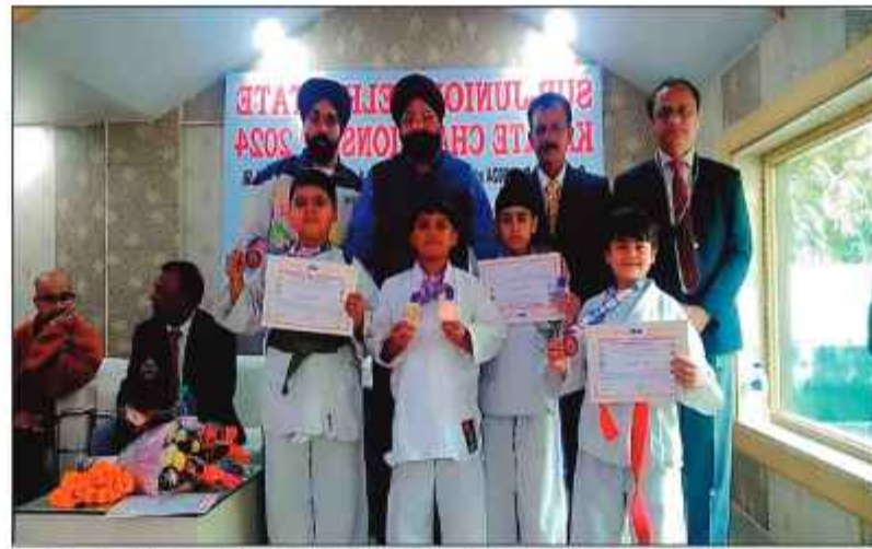
बच्चों को हार्दिक बधाई देते उनके भविष्य के लिए मंगल कामना की।