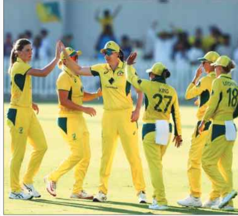
पहले मैच में भी भारतीय टीम को 5 विकेट से हराया था। ऐसे में अब वह सीरीज में 2-0 से आगे हो गयी है।