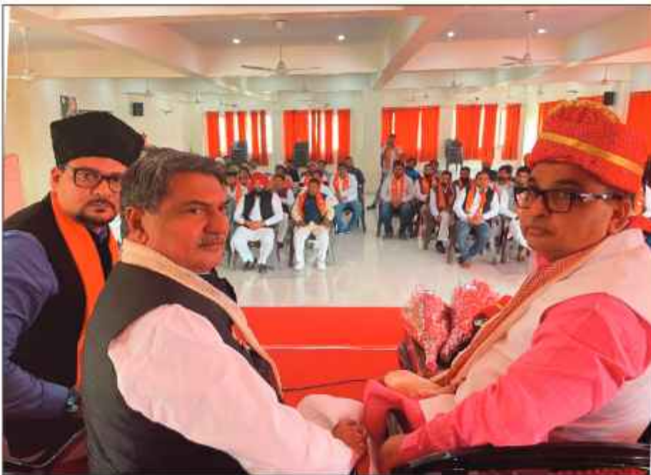
अलम खान ने शिरकत की। बैठक में भाजपा अल्पसंख्यक मोर्चा के सैकड़ों पदाधिकारियों ने शिरकत की तथा सभी अतिथियों का फूलमालाओं के साथ स्वागत किया गया। बैठक में मुख्य अतिथि जमाल

रविवार को सोनीपत के सेक्टर 7 स्थित भाजपा कार्यालय पर हरियाणा भाजपा अल्पसंख्यक मोर्चा की बैठक आयोजित हुई, जिसमें मुख्य अतिथि अल्पसंख्यक मोर्चा के राष्ट्रीय अध्यक्ष जमाल सिद्दीकी रहे तथा विशिष्ट अतिथि के रूप में प्रदेश प्रभारी राजीव जैन, भाजपा अल्पसंख्यक मोर्चा के राष्ट्रीय उपाध्यक्ष चौधरी जाकिर हुसैन पूर्व विधायक व राष्ट्रीय मंत्री डॉ. अलम खान ने शिरकत की। बैठक में भाजपा अल्पसंख्यक मोर्चा के सैकड़ों पदाधिकारियों ने शिरकत की तथा सभी अतिथियों का फूलमालाओं के साथ स्वागत किया गया। बैठक में मुख्य अतिथि जमाल