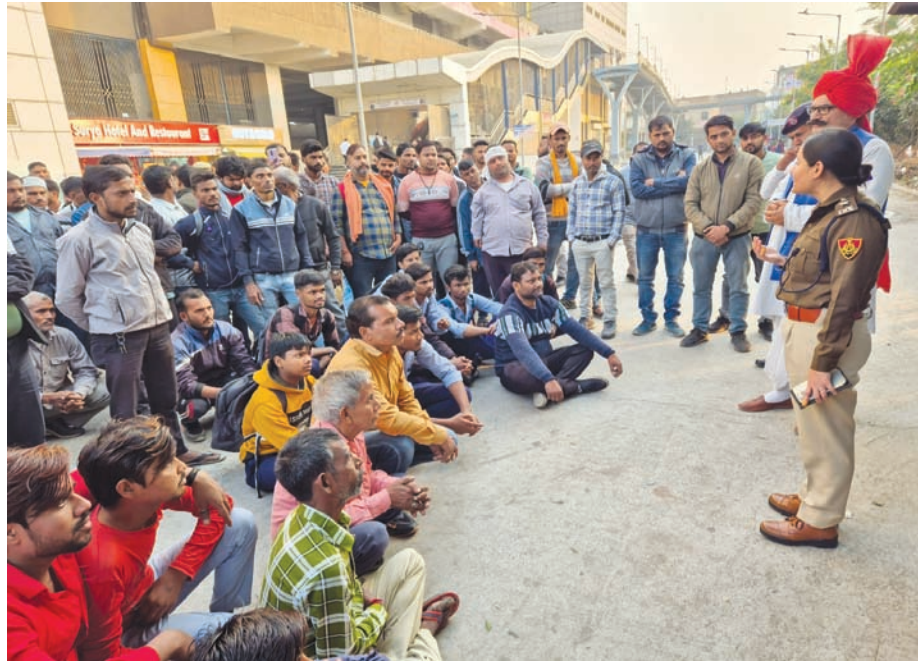
मुआवजा: जनता को हिट एंड रन मामलों में मिलने वाले मुआवजे के बारे में

कोई आपका इंतजार कर रहा है, इसलिए अपनी सुरक्षा का ध्यान रखें। 2. सड़क पार करने के नियम: सड़क पार करते समय ईयरफोन का उपयोग न करने की सलाह दी गई, ताकि वाहन आवाज सुनकर सतर्क रहें। दोनों ओर देखकर ही सड़क पार करें और गिरल को पार न करें, क्योंकि इससे दुर्घटना की संभावना बढ़ जाती है। लोगों को बताया गया कि सड़क पार करने के लिए हमेशा फुटओवर ब्रिज या जेब्रा क्रॉसिंग का उपयोग करें। 3. चार पहिया वाहन चालकों के लिए सुझाव: चार पहिया वाहन चालकों को सीट बेल्ट का उपयोग करने की अनिवार्यता पर जोर दिया गया। सीट बेल्ट न लगाने से गंभीर दुर्घटना में जान का खतरा बढ़ जाता है। 4. हिट एंड रन मामलों में