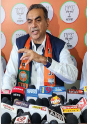
कारण ही भारतीय जनता पार्टी लगातार जीत रही है।