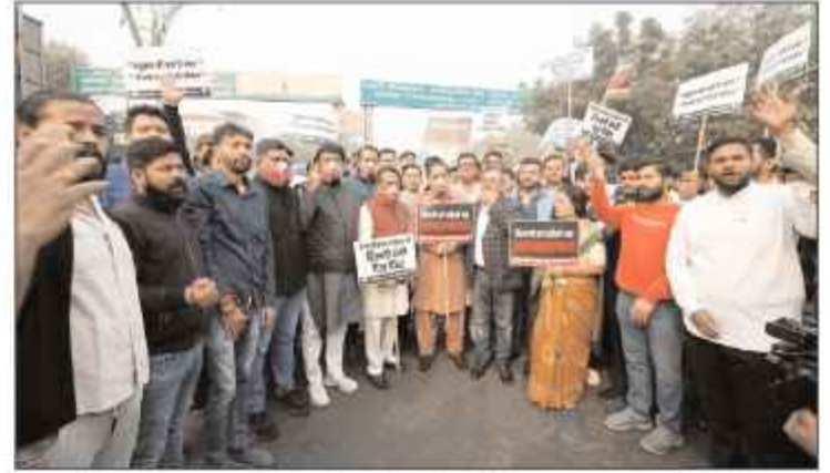
हजार करोड़ रुपये एनवायरमेंटल सेस के रूप में वसूला। उसका हिसाब दिया जाए, ताकि जनता के बीच में स्थिति स्पष्ट हो सके कि उसे कहा खर्च किया जाए। मैं आपको बताता हूँ कि यह एक हजार करोड़ रुपये केजरीवाल सरकार ने खर्चों पर उन पोस्टर्स को लगाने में खर्च किया है, जिसमें लिखा हुआ था कि हम दिल्ली को प्रदूषण मुक्त बनाएंगे। कुल मिलाकर यह एक हजार करोड़ रुपये भी भ्रष्टाचार की भेंट चढ़ गए। दिल्ली सरकार को प्रदूषण को लेकर गंभीर कदम उठाने होंगे, नहीं तो दिल्ली की जनता को यह मास्क पहनना होगा।

हटाएंगे। दिल्ली में सांसों का आपातकाल है और निरसिंह इसके लिए केजरीवाल सरकार जिम्मेदार है। आम आदमी पार्टी शक्ति राज्य पंजाब में पराली जलाई जा रही है। लेकिन, अरविंद केजरीवाल कोई कदम नहीं उठा रहे हैं। इसका खामियाजा दिल्ली की जनता को भुगताना पड़ रहा है।' वहीं प्रदर्शन में शामिल भाजपा नेता हर्ष मल्होत्रा ने भी प्रदूषण को लेकर दिल्ली सरकार पर निशाना साधा। उन्होंने कहा, 'दिल्ली सरकार बार-बार केंद्र सरकार पर निशाना साध रही है। लेकिन, मैं एक बात कहना चाहता हूँ कि दिल्ली के चारों तरफ ईस्टर्न-वेस्टर्न परिफेरल वे बनाया गया। यह इसलिए बनाया गया, ताकि दिल्ली के अंदर से जो 4 हजार वाहन यूपी से हरियाणा जाने के लिए गुजरते थे। अब उनको वहां जाने की जरूरत नहीं है। केंद्र सरकार ने इतना बड़ा काम किया है।' उन्होंने आगे कहा कि मैं दिल्ली सरकार से यह पूछना चाहता हूँ कि केजरीवाल सरकार ने 1