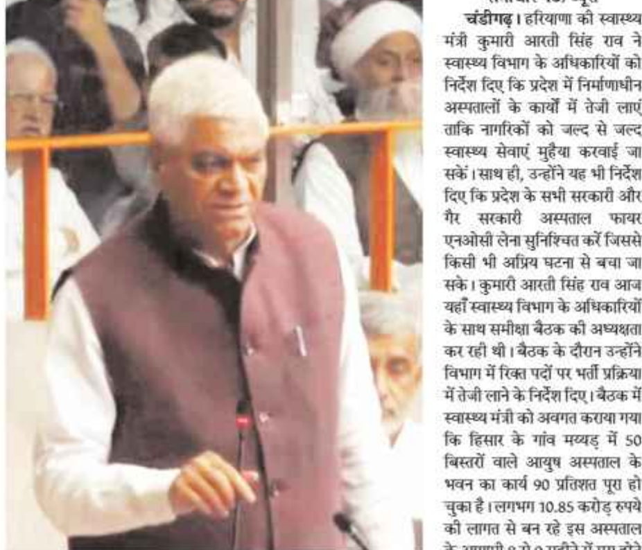
को उपमंडल बनाने बल्लभगढ़ ब्लॉक का नाम बदलकर उसे दयालपुर, अटली या लखंसा में से किसी एक गांव के नाम पर रखने, गांव अलावलपुर में सरकारी कॉलेज खोलने के अलावा इलाके की सभी सड़कों को दुरुस्त करने की मांग उठा चुके हैं।