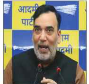
करता हूँ कि क्लाइड संचालन के लिए एनएससी/मंजूरी जारी करने में शामिल दिल्ली सरकार, आईआईटी कानपुर और अन्य सभी संबंधित विभागों/एजेंसियों जैसे डीजीसीए, एमएचए, रक्षा मंत्रालय आदि के साथ तुरंत एक आपातकालीन बैठक बुलाएं।'

निपटने के लिए और वायु गुणवत्ता में सुधार के लिए तत्काल रहत के लिए वैकल्पिक समाधान तलाशने के लिए निरंतर प्रयास किए जा रहे हैं। क्लाइड सीडिंग एक ऐसी प्रक्रिया है जिसमें वातावरण से वायु प्रदूषण को कम करने के लिए कृत्रिम रूप से बारिश कराई जाती है। दिल्ली सरकार ने आईआईटी कानपुर की मदद से पिछले साल ऐसे महत्वपूर्ण समय के दौरान कृत्रिम रूप से बारिश कराने और वायु प्रदूषण को कम करने के लिए एक आपातकालीन उपाय के रूप में क्लाइड सीडिंग की खोज की थी और देखा कि इसे लागू करने के लिए विभिन्न एजेंसियों से पूर्व मंजूरी की आवश्यकता होती है। यह देखते हुए कि दिल्ली में वायु गुणवत्ता गंभीर श्रेणी में आ गई है, मेरा मानना है कि वर्तमान स्थिति में इस पद्धति के उपयोग पर तुरंत विचार करने की आवश्यकता है। अपने पत्र में गोपाल राय ने लिखा, 'मैं एक बार फिर आपसे अनुरोध