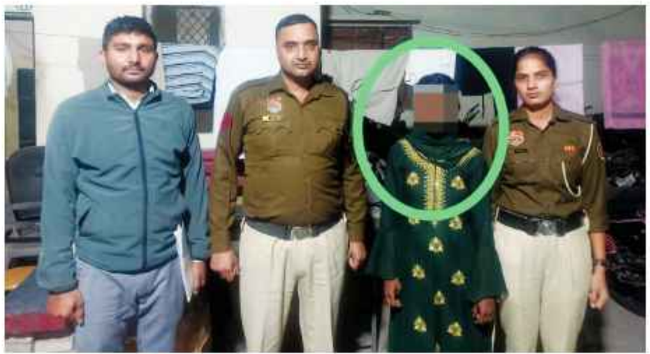
परिजनों से किसी बात को लेकर नाराज थी जिसके कारण वह बिना बताए घर से निकल गई थी। जिसको परिजनों के हवाले किया है। परिजनों के द्वारा पुलिस टीम का धन्यवाद किया।

मामले में अपराध शाखा चक्र व पुलिस चौकी सेक्टर-16 की टीम ने संयुक्त रूप से कार्रवाई करते हुए अपने गुप्त सूत्रों से प्राप्त सूचना से मऊ जिला उत्तर प्रदेश का पता लगाया। जहां से लडकी को तलाश कर फरीदाबाद लाया गया। लडकी ने पृष्ठताल में बताया कि वह अपने