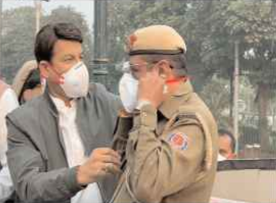
खतरनाक स्तर पर पहुंच चुका है। इसी को देखते हुए मनोज तिवारी लोगों को बीच मास्क बांट रहे हैं। उन्होंने कहा, 'मैं मॉडिया को धन्यवाद करना चाहता हूँ, जो लगातार इस समस्या को चैनलों में दिखा रहे हैं। यह तो हमारा दुर्भाग्य है कि हम 2016 से यहाँ

नई दिल्ली (एजेंसी)। भारतीय जनता पार्टी (भाजपा) के वरिष्ठ नेता और नई दिल्ली नगरपालिका परिषद (एनडीएमसी) के नए उपाध्यक्ष कुलनीत चहल ने दिल्ली के कर्नाट पोस्ट इलाके में लोगों को मास्क बांटे। इस दौरान उन्होंने आम लोगों को प्रदूषण के प्रति जागरूक करते हुए भी दिखे। मास्क बांटने के बाद मनोज तिवारी ने पत्रकारों से इस संबंध में बातचीत भी की। उन्होंने कहा, 'मौजूदा समय में दिल्ली में प्रदूषण अपने खतरनाक स्तर पर पहुंच चुका है। आलम यह है कि लोगों का सांस लेना दूसरों को चुका है। लोग अपनी जिंदगी को खतरे में डालने पर विचार नहीं करते हैं। ऐसे स्थिति में हम लोगों को जागरूक कर रहे हैं। हम 3 करोड़ लोगों के बीच मास्क बांट सकते लेकिन उन्हें जागरूक कर सकते हैं। इससे लोगों के बीच में यह संदेश जाएगा कि राष्ट्रीय राजधानी दिल्ली में प्रदूषण अपने