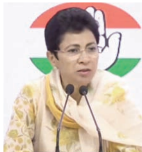
हजार का है। उन्होंने कहा कि चौंकाने वाली बात ये है कि प्रदेश में

की संख्या का आंकड़ा बढ़ रहा है बल्कि मौत के मामलों में भी वृद्धि हो रही है। हरियाणा में हालात भयावह बने हुए हैं। जहां कैसर अब काल बनता जा रहा है। आंकड़ों की माने तो प्रदेश में हर माह कैसर के 2916 नए मरीज सामने आ रहे हैं और साल में इनकी संख्या 35 हजार के करीब पहुंच जाती है। कैसर के मरीजों की मौत की बात करें हरियाणा में हर माह 1500 कैसर मरीज दम तोड़ रहे हैं और साल में यह आंकड़ा 18