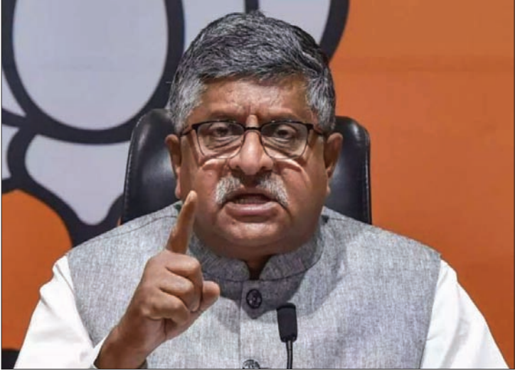
होने नहीं देगी। उन्होंने कहा कि कर्नाटक में वहां की कांग्रेस सरकार पब्लिक टेंडर में मुस्लिमों को चार प्रतिशत का आरक्षण देने का फैसला लिया है। धर्म के नाम पर किसी को आरक्षण नहीं दिया जा सकता। वोट बैंक के नाम पर कांग्रेस देश को तोड़ने का काम कर रही है। देश को कमजोर करने की कोशिश की जा रही है।

प्रसाद ने नई दिल्ली में पार्टी मुख्यालय में आयोजित संवाददाता सम्मेलन को संबोधित करते हुए दावा किया कि देश की सबसे पुरानी पार्टी चुनावों के लिए राष्ट्रीय एकता के विरोधी संगठन के साथ गठबंधन कर रही है। उन्होंने आरोप लगाया कि कांग्रेस वोट लेने के लिए देश को तोड़ने का काम कर रही है। उन्होंने प्रधानमंत्री मोदी के नारे एक रहे तो सुरक्षित रहेंगे को जरूरी बताते हुए कहा कि चुनाव में कांग्रेस पार्टी का सफाया हो रहा है। कांग्रेस ओबीसी और दलितों का अधिकार छीन कर मुस्लिमों को देना चाहती है लेकिन भाजपा ऐसा