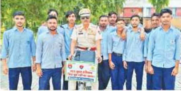
हूए कहा कि छोड़ो शर्माना अच्छे स्वास्थ्य के लिए साइकिल से करो आना जाना। हमारे पूर्वजों को नहीं होता था कोई रोग क्योंकि वे सदा करते थे साइकिल का प्रयोग। उन्होंने पर्यावरण संरक्षण के साथ सड़कों पर गाड़ियों की संख्या में वृद्धि पर चिंता व्यक्त करते हुए कहा कि अधिक से अधिक पीछे रोपित करने चाहिए। उन्होंने विद्यार्थियों को सड़क सुरक्षा के नियमों का पालन करने के लिए भी विस्तार से बताया और कहा कि