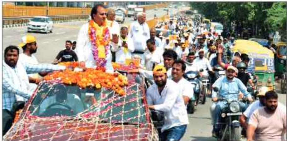
नेशनल हाईवे से गुजरती परिवर्तन रैली में जमा अपार भीड़