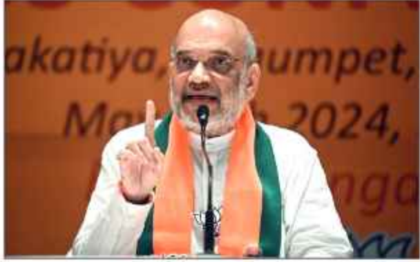
'उपलब्धियों के आधार पर लड़ेंगे चुनाव'

जींद। हरियाणा बीजेपी में टिकटों को लेकर मंचे घमासान के बीच केंद्रीय गुप्तचर अमित शाह का हरियाणा दौरा रह रहा है। उन्हें 1 सितंबर को जींद में जन आशीर्वाद रैली में शामिल होना था। इसी रैली से बीजेपी द्वारा प्रदेश में चुनावी कैम्पेन की शुरुआत करनी थी। माना जा रहा है टिकटों को लेकर मंचे घमासान को लेकर अमित शाह ने जींद रैली में आना कैंसल कर दिया है। रैली के संयोजक पूर्व सांसद संजय भाटिया ने शनिवार को शाह का कार्यक्रम रद्द होने की पुष्टि की है।