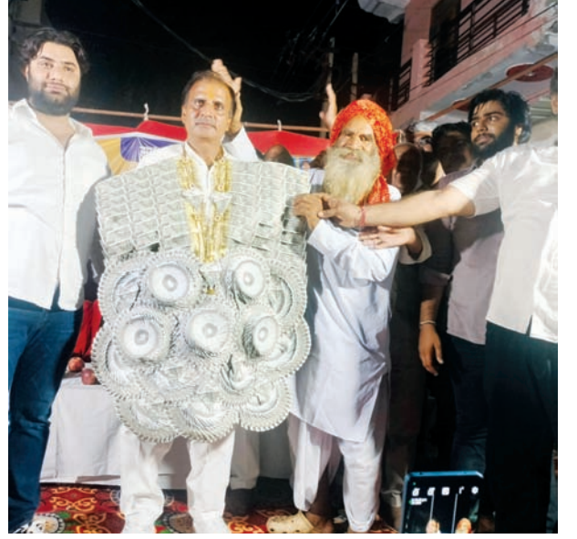
नोटों की माला पहनाकर अपना आशीर्वाद देकर समर्थन देते समर्थक

चौपाल, एक बजे आदर्श नगर, दो बजे मुजेर और मशीन मार्केट, सहित सेक्टर तीन, विष्णु कालोनी, बनियावाड़ा, भूदत कालोनी, सुभाष कालोनी, भाटिया कालोनी ब्लॉक सी और ब्लॉक ए में रात करीब आठ से दस बजे तक जनसम्पर्क कार्यक्रम आयोजित किए। जिनमें उन्हें जनता का पूरा समर्थन मिला। महिलाओं