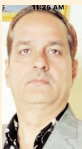
नवीर यादव कार्यकारी संपादक

हरियाणा में 10 साल से सत्ता से बाहर रही कांग्रेस के लिए इस बार उम्मीद की किरण दिखाई दे रही है। हालांकि, पार्टी के सामने अंतरकलह की स्थिति भी देखने को मिल रही है। स्थितियां सत्तारूढ़ भाजपा के लिए भी सहज नहीं हैं। किसान, जवान और पहलवानों की नाराजगी को कांग्रेस भुनाने की कोशिश कर रही है। यही कारण है कि कांग्रेस के लिए एक मंच तैयार होता दिखाई दे रहा है। लेकिन आंतरिक युद्ध की वजह से पार्टी के लिए स्थितियां मुश्किल होती दिखाई दे रही है।