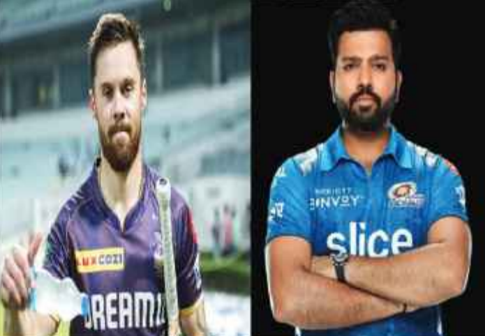
भारत और ऑस्ट्रेलिया के बीच सीरीज 22 नवंबर से पर्थ में पहले टेस्ट के साथ शुरू होगी। वहीं एडिलेड ओवल में 6 से 10 दिसंबर तक होने वाला दूसरा टेस्ट दिन-रात प्रारूप में खेला जाएगा। इसके बाद, प्रसंसको का घ्यान तीसरे टेस्ट के लिए ब्रिस्बेन के गाबा पर होगा, जो 14 से 18 दिसंबर तक आयोजित किया जाएगा। मेलबर्न के मशहूर मेलबर्न क्रिकेट मैदान में 26 से 30 दिसंबर के बीच पारंपरिक बॉक्सिंग डे टेस्ट होगा। वहीं 3 से 7 जनवरी तक सिडनी क्रिकेट मैदान में 5वां और अंतिम टेस्ट खेला जाएगा।