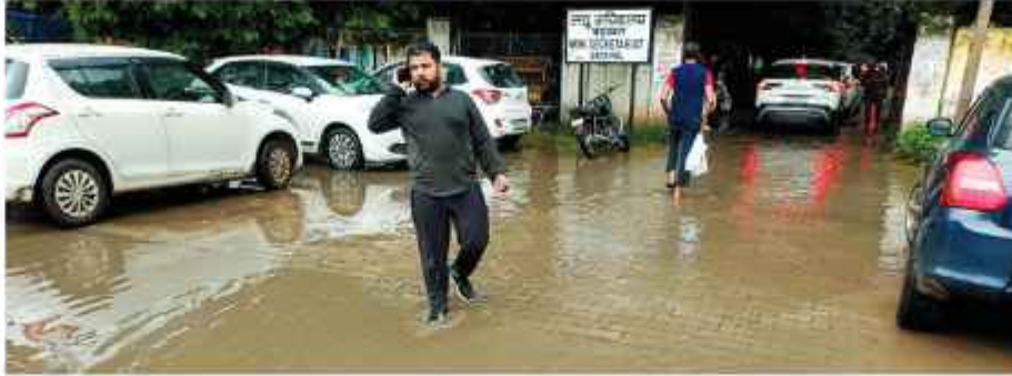
बड़खल तहसील के बाहर और भीतर भरा पानी

निगम के द्वारा नाले और नालियों की सफाई के बाद निकाला गया कचरा बरसात के कारण दोबारा से नाली और नाले में चला गया। प्रशासन का दावा है कि सभी नालों की सफाई की जा चुकी है। लेकिन