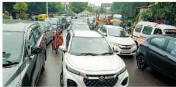
बोके चौक से एनएच पांच व नीलम और एक नम्बर तक लगा जाम