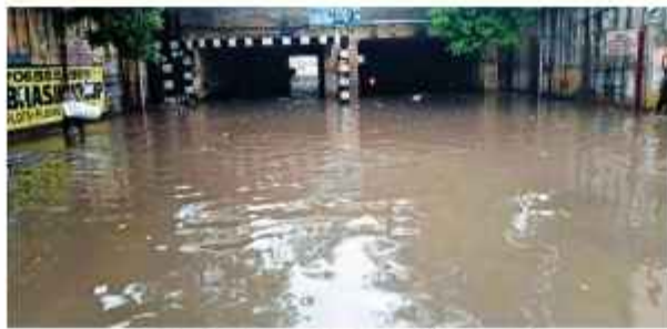
ओल्ड फरीदाबाद अंडरपास में भरा पानी

बरसात से दोबारा चली गई नाली और नालों में गंदगी