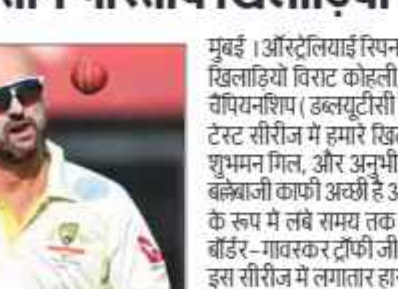
मुंबई। ऑस्ट्रेलियाई स्पिनर नाथन लियोन ने कहा है कि इस साल के अंत में होने वाली बॉर्डर-गावस्कर सीरीज में उनकी टीम को तीन भारतीय खिलाड़ियों विराट कोहली, रोहित शर्मा और ऋषभ पंत से सतर्क रहना होगा। लियोन के अनुसार 22 नवंबर से होने वाली ये सीरीज टेस्ट चैम्पियनशिप (डब्ल्यूटीसी) में शामिल होने के कारण और अहम हो जाती है। लियोन ने कहा, रोहित शर्मा, विराट कोहली और ऋषभ पंत आगामी टेस्ट सीरीज में हमारे खिलाफ अपना सर्वश्रेष्ठ प्रदर्शन करना चाहेंगे। साथ ही कहा कि इन तीनों के अलावा युवा खिलाड़ी यशरवी जायसवाल, शुभमन गिल, और अनुभवी रविंद्र जडेजा भी हमारे लिए मुश्किलें पैदा कर सकते हैं। मैजबान टीम के इस स्पिनर ने कहा कि भारतीय टीम की बल्लेबाजी काफी अच्छी है और ऑस्ट्रेलिया के गेंदबाजों के लिए उन्हें आउट करना आसान नहीं रहेगा। उन्होंने कहा, अगर हम एक गेंदबाजी इकाई के रूप में तबे समय तक अच्छा प्रदर्शन करते हैं, तो हम भारतीय टीम को बेहतर तरीके से चुनौती दे सकते हैं। भारतीय टीम ने पिछली बार बॉर्डर-गावस्कर ट्रोफी जीती है। इसमें भी दो बार भारतीय टीम ऑस्ट्रेलिया में जीतने में सफल रही है। 120 14 के बाद से ही ऑस्ट्रेलियाई टीम को इस सीरीज में लगातार हार का सामना करना पड़ा है।