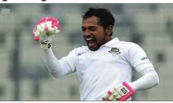
-टीम में विकेटकीपर के तौर पर हे धोनी जैसा बचाव

मुम्बई (एजेंसी)। बांग्लादेश के साथ 19 सितंबर से होने वाली टेस्ट सीरीज में भारतीय टीम जीत की प्रबल उम्मीद है। भारतीय टीम को आज तक बांग्लादेश की टीम धरुल मुद्दीन पर नहीं हरा पायी है। हालांकि इसके बाद भी उसे टीम के विकेटकीपर बल्लेबाज मुशफिकुर रहम सहित कुछ खिलाड़ियों से सावधान रहना होगा। मुशफिकुर का रिकार्ड काफी अच्छा है, इस खिलाड़ी ने