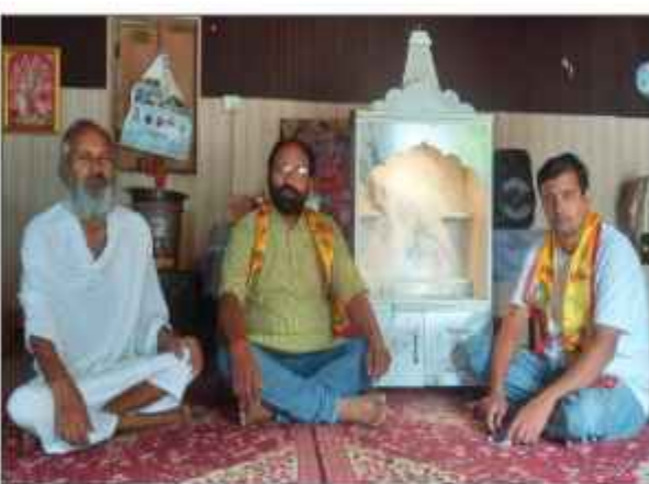
समाचार गेट ब्यूरो, फरीदाबाद