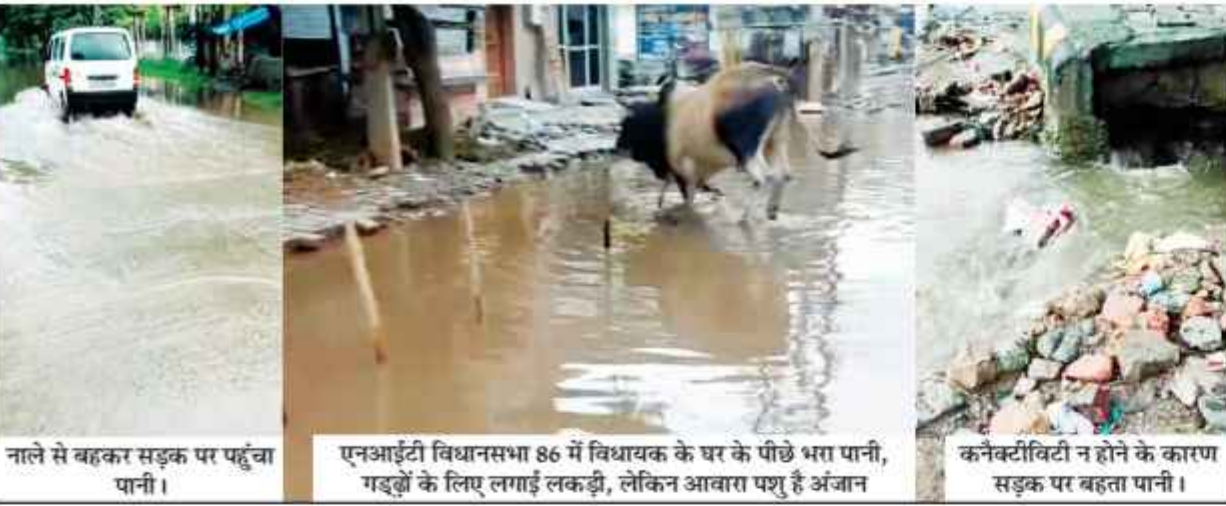
नाले से बहकर सड़क पर पहुंचा पानी।

नालों की कनेक्टिविटी न होने के कारण भी बढ़ रही है परेशानी