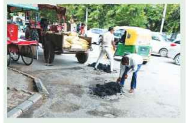
समाचार गेट ब्यूरो

फरीदाबाद। उपायुक्त विक्रम सिंह द्वारा जिला फरीदाबाद की सड़कों एवं मुख्य मार्गों को गड्ढा मुक्त बनाने तथा सड़कों तथा मुख्य मार्गों की मरम्मत तथा पैच वर्क के लिए नगर निगम, पीडब्ल्यूडी, एफ.एम.डी.ए. तथा एन.एच.ए.आई सहित अन्य सभी संबंधित विभागों के अधिकारियों को निर्देश जारी गये हैं कि सभी अधिकारी उनके विभागों के अंतर्गत आने वाली सड़कों एवं मुख्य मार्गों के मरम्मत तथा पैच वर्क जल्द से जल्द पूरा कारवायें तथा इस संबंध में प्रगति रिपोर्ट भी उनके कार्यालय में निर्यात रूप से भिजवावें। उपायुक्त ने कहा कि जिला फरीदाबाद की सड़कों व मुख्य मार्गों को गड्ढा मुक्त बनाने तक यह मरम्मत एवं गड्ढे भरने का कार्य नितर चलाता रहेगा। उपायुक्त विक्रम सिंह के आदेशों की पालना में पैच वर्क गड्ढे भरने का कार्य तेजी से करवाया जा रहा है। जिनमें विभिन्न स्थानों पर सड़कों एवं मुख्य मार्गों की मरम्मत का कार्य करवा दिया गया है तथा बहुत स्थानों पर मरम्मत कार्य प्रगति पर है। इसी क्रम में आज बुधवार को नगर निगम द्वारा के.एल. मेहता रोड, ब्लाक-जी एन.आई.टी. फरीदाबाद, एन.आई.टी. बस स्टैंड, नेहरू ग्राउंड, निरय लॉयंस क्लब, बी.के. चौक, वार्ड नं-15, के.सी. रोड, एस.जी.एम. नगर, भीकम कॉलोनी, जैन कॉलोनी व अन्य कई स्थानों पर सड़कों की मरम्मत करवाई गई व गड्ढों को भरवाया गया।