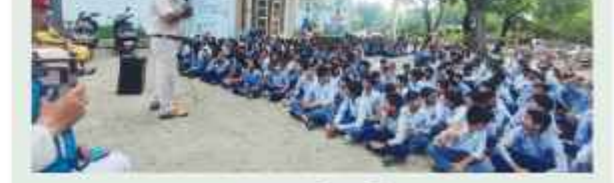
समाचार गेट ब्यूरो

फरीदाबाद। सामुदायिक पुलिसिंग टीम द्वारा राजकीय वरिष्ठ माध्यमिक विद्यालय, फरीदपुर, राजकीय प्राथमिक विद्यालय, फरीदपुर, राजकीय माध्यमिक विद्यालय, फरीदा, और नॉर्थ स्टार स्पोर्ट्स अकेडमी फरीदपुर में निम्न प्रकार से जागरूक कार्यक्रम आयोजित किए गए, जिसमें लगभग 1000 छात्रों ने भाग लिया। इस कार्यक्रम के दौरान सामुदायिक पुलिसिंग टीम ने विद्यार्थियों को सड़क सुरक्षा नियमों के बारे में विस्तार से जानकारी दी। टीम ने साइबर सुरक्षा के महत्वपूर्ण पहलुओं पर प्रकाश डाला तथा बतलाया कि साइबर अपराधों से बचने का एकमात्र उपाय जागरूकता और सावधानी है। कार्यक्रम के दौरान, पुलिस ताक ने सभी को नशे के दुष्प्रभावों के बारे में जागरूक किया। फरीदाबाद पुलिस द्वारा नशे पर बनाए गए गाने को पुलिस कर्मचारी द्वारा गाना गाकर भी शिक्षकों एवं विद्यार्थियों को जागरूक किया। कार्यक्रम के समापन पर, सड़क दुर्घटनाओं में मृत व्यक्तियों की आत्मा को शांति के लिए 2 मिनट का मौन रखा गया और सभी छात्रों व शिक्षकों ने समाज को नशा मुक्त, अपराध मुक्त, और सुरक्षित बनाने के लिए शपथ ग्रहण की।