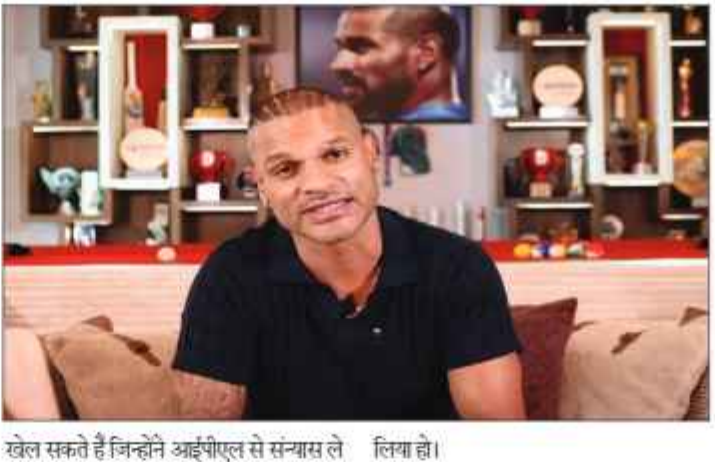
खेल सकते हैं जिन्होंने आईपीएल से संन्यास ले लिया है।

देखने के लिए उत्सुक हैं। इससे दिग्गज क्रिकेटियों के लिए दूसरी पारी के रूप में हमारी स्थिति और मजबूत होगी। संन्यास के बाद से ही कई दिग्गज क्रिकेटर इस लीग का हिस्सा हैं। इनमें एरोन फिच, मार्टिन गुट्टिफ्रान, इफ्रान पटन, मौजूदा हेड कोच गौतम गंभीर, श्रीरस्त, सुरेश रैना, युसूफ पटन और हाशिम अमला जैसे क्रिकेटर हैं। लीजेंड्स लीग क्रिकेट का अगला सत्र सितंबर 2024 में शुरू होगा। इसमें रिटायर्ड क्रिकेटर रोमांचक मैचों को एक सीरीज में प्रतिस्पर्धा करेंगे। धवन की भागीदारी से इसमें और भी आकर्षण आयेगा क्योंकि प्रशंसक फिर से मैदान पर उनकी बल्लेबाजी को देखने का बेसब्री से इंतजार कर रहे हैं। लीजेंड्स लीग में केवल वे ही पूर्व क्रिकेटर