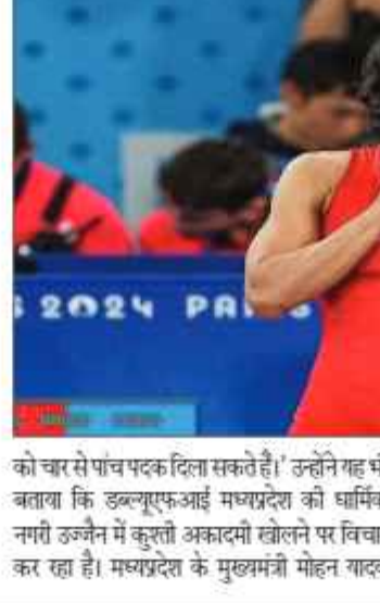
को चार से पांच पदक दिला सकते हैं।' उन्होंने यह भी बताया कि डब्ल्यूएफआई मध्यप्रदेश की घासिक नगरी उज्जैन में कुश्ती अकादमी खोलने पर विचार कर रहा है। मध्यप्रदेश के मुख्यमंत्री मोहन यादव राज्य कुश्ती संघ के अध्यक्ष भी हैं। डब्ल्यूएफआई अध्यक्ष ने बताया, 'उज्जैन में कुश्ती की अकादमी खोलने की योजना को लेकर हमारी मुख्यमंत्री से शुद्ध आती दौर की बातचीत चल रही है।'

की उम्मीद कर रहे थे, लेकिन देश विरोधी ताकतों के षड्यंत्र के तहत 18 महीने तक कुश्ती की गतिविधियां ठप कर दी गईं। इस ऑडोलन के चलते देश को ओलंपिक में केवल एक पदक मिल सका।' संजय ने कहा, 'मैं कुश्ती और राजनीति को अलग-अलग रखना चाहता हूँ। इसलिए मैं ऐसे किसी भी व्यक्ति का नाम लेना नहीं चाहता जिसने यह ऑडोलन खड़ा किया था लेकिन कुश्ती में राजनीति घुसने को वह संतो से ही पेरिस ओलंपिक में कुश्ती का यह हज्र हुआ।' उन्होंने हाल ही में जॉर्डन में खेले गई विश्व चैंपियनशिप में भारत की अंश-17 महिला कुश्ती टीम के शानदार प्रदर्शन का स्वागत करते हुए कहा कि भारतीय महिला कुश्ती बहुत अच्छी स्थिति में है और लगातार आगे जा रही है। संजय ने कहा, 'अगर डब्ल्यूएफआई को स्वतंत्र रूप से अपना काम करने दिया जाए और दो-चार संस्थाएं हमारे काम-काज में दखल देना बंद कर दें, तो हम अगले ओलंपिक में महिला कुश्ती में देश