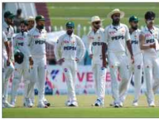
हफीज ने नकवी की विश्व कप के दौरान पाकिस्तान क्रिकेट में बड़ा बदलाव करने की टिप्पणी याद दिलाते हुए कटाक्ष किया। पाकिस्तानी टीम जब विश्व टी20 कप से बाहर हो गई थी तब भारत से हार के बाद नकवी ने कहा था, 'शुरू में मुझे लगा कि खेरा बदलाव ही काफी होगा। लेकिन इस खराब प्रदर्शन के बाद यह स्पष्ट है कि एक बड़े बदलाव की जरूरत है। देश के क्रिकेट में जल्द ही बड़े बदलाव होंगे।' टीम में कोई बदलाव नहीं किया गया है और शान मसूद की कप्तानी में बांग्लादेश के खिलाफ पहले टेस्ट में वही सीनियर खिलाड़ी मैदान पर उतरे। नकवी ने कहा कि पाकिस्तान क्रिकेट में चीजें बदलेंगी।

बांग्लादेश के खिलाफ करारी हार के बाद पाकिस्तान टीम में होगा बदलाव, पीसीबी अध्यक्ष ने किया वादा लाहौर (एजेंसी)। पाकिस्तान क्रिकेट बोर्ड (पीसीबी) अध्यक्ष मोहम्मिन नकवी ने पहले टेस्ट में बांग्लादेश के खिलाफ राष्ट्रीय टीम की करारी हार के बाद सोमवार को समस्यकों को ठीक करने की बात करते हुए कहा कि बदलाव होने वाले हैं। शाहिद अफरीदी, मोहम्मद हफीज और फख्रुद आलम जैसे पूर्व खिलाड़ियों ने रविवार को रावलपिंडी में बांग्लादेश से मिली 10 विकेट से मिली हार के लिए राष्ट्रीय टीम की आलोचना की। नकवी ने मीडिया से बात करते हुए कहा, 'मैं पाकिस्तान क्रिकेट में समस्यकों को ठीक करूंगा। और पाकिस्तान क्रिकेट में बदलाव होने वाले हैं।'