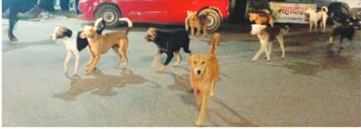
की संख्या करीब 30 से 40 हजार बताई जा रही है। लेकिन इसके

कुत्तों के हमले का शिकार होने के बाद हर रोज करीब 200 के आसपास लोग रैबिज के इंजेक्शन लगवाने के लिए बीके अस्पताल, बल्लभगढ़ सिविल अस्पताल समेत स्वास्थ्य केंद्रों व ईएसआईसी मेडिकल कॉलेज में जाते हैं। अनुमान है कि इससे करीब दो गुणा मरीज निजी अस्पतालों और क्लिनिकों में रैबिज के टीके लगवाते हैं। इससे स्पष्ट होता है कि आवारा कुत्तों के काटने की समस्या जिले में कितनी गंभीर होती जा रही है। लेकिन नगर निगम और सरकार इस मामले को लेकर जरा भी गंभीरता नहीं दिखा रही है। जिसका खामियाजा आम लोगों को भुगतना पड़ रहा है।