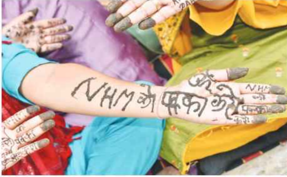
चिकित्सक अवकाश पर है, लेकिन जिला स्वास्थ्य विभाग ऐसे चिकित्सकों की सुध ही नहीं ले रहा

फरीदाबाद। एनएचएम कर्मचारियों को हड़ताल का जहां एक तरफ 12वां दिन था। वहीं एचआईवी/एड्स विभाग के कर्मचारियों को हड़ताल का मंगलवार को छठों दिन था। ऐसे में सावन के महीने में आने वाले तीज पर्व के एक दिन पहले सभी महिला कर्मचारियों ने हाथों में मेहंदी लगाई और पक्का करने की मांग उठाई। वहीं दूसरी तरफ स्वास्थ्य केन्द्रों में भी स्वास्थ्य सुविधाएं बुरी तरह से चरमसाईं नजर आईं। स्वास्थ्य केन्द्रों समेत डिलीवरी हर्टों पर स्वास्थ्य विभाग के द्वारा तैनात किए गए चिकित्सक पहुंच ही नहीं रहे हैं। ऐसा ही सारन स्थित यूपीएचसी में देखने को मिला, जहां दो दिनों से