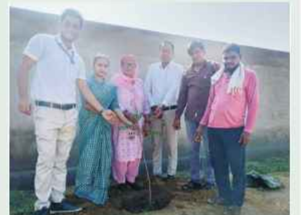
समाचार गेट/सोनिका सुरा