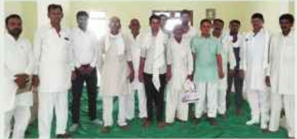
समाचार गेट/सोनिका सुरा