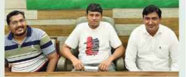
समाचार गेट/सोनिका सुरा