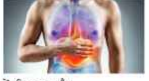
में भी मददगार है।