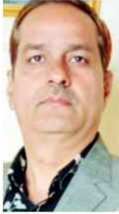
नरवीर यादव एसोसिएट एडिटर

राजनीति के केंद्र में स्थापित होने के बाद प्रधानमंत्री नरेंद्र मोदी का व्यक्तिगत विराट होकर उभरा है, इसके साथ वह भी सच है कि उनकी खास पहचान उनकी दाढ़ी है। साल 2013 में जब बीजेपी ने मोदी को प्रधानमंत्री पद का अपनी ओर से दावेदार बनाया था, उन्हीं दिनों एक तमिल टीवी पर चर्चा में तमिलनाडु के बीजेपी का एक चेहरा भी शामिल हुआ था। उस नेता ने अपनी पार्टी का दमदार तरीके से पक्ष रखा। उसका कार्यक्रम का ऐसा प्रभाव रहा कि उन्हें दर्शकों ने तमिलनाडु के मोदी के रूप में पुकारना शुरू कर दिया। तमिलनाडु के वही मोदी अब महाराष्ट्र के राज्यपाल हैं। जी हाँ, आपने ठीक समझा, तमिलनाडु के लोग सी पी राधाकृष्णन को तमिलनाडु के मोदी के रूप में भी जानते हैं।