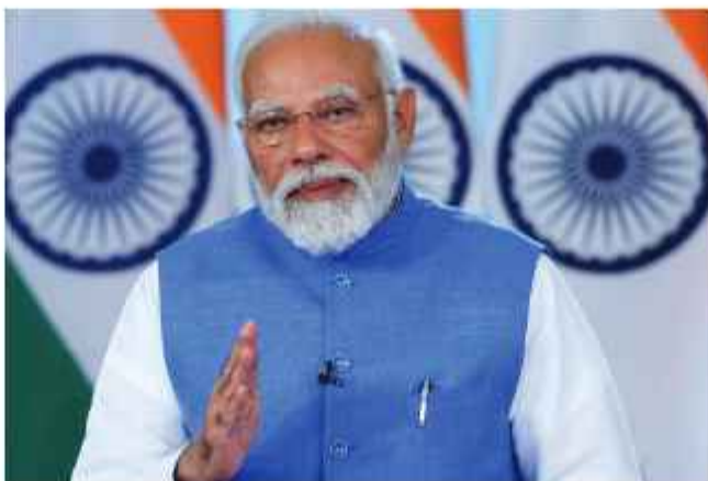
प्रति लोक देश के मैन्युफैक्चरिंग क्षेत्र का तीन गुना विस्तार होने का अनुमान है। जो मौजूदा 459 बिलियन डॉलर से 1.66 ट्रिलियन डॉलर तक पहुंच जाएगा। यह वृद्धि पिछले दशक में हुई 175 बिलियन

नई दिल्ली (एजेंसी)। मोदी सरकार की प्रोडक्शन-लिंकड इंडेक्स (पीएलआई) योजना, स्थानीय उत्पादों को बढ़ावा देने के साथ इसके लिए आयुर्त श्रृंखला केंद्र बनाने और मजबूत नीटोपी दर हासिल करने की दिशा में आगे बढ़ने की वजह से भारत अगले दशक में वैश्विक आर्थिक महाशक्ति बनने की दिशा में आगे बढ़ेगा। बीते 10 वर्षों में प्रधानमंत्री नरेंद्र मोदी और उनकी सरकार द्वारा शुरू की गई विभिन्न योजनाओं के कारण देश ने अपनी मजबूत आर्थिक यात्रा शुरू की। चाहे वह लोकल उत्पादों के निर्माण, नए सेमीकंडक्टर संयंत्र, एआई, 5जी, स्टार्टअप, नवाचार और विभिन्न क्षेत्रों के लिए पीएलआई योजनाओं पर जोर हो या फिर श्रमिकों को कुशल बनाना और लाखों नई नौकरियां पैदा करना हो। इसके बाद पीएलआई योजना से