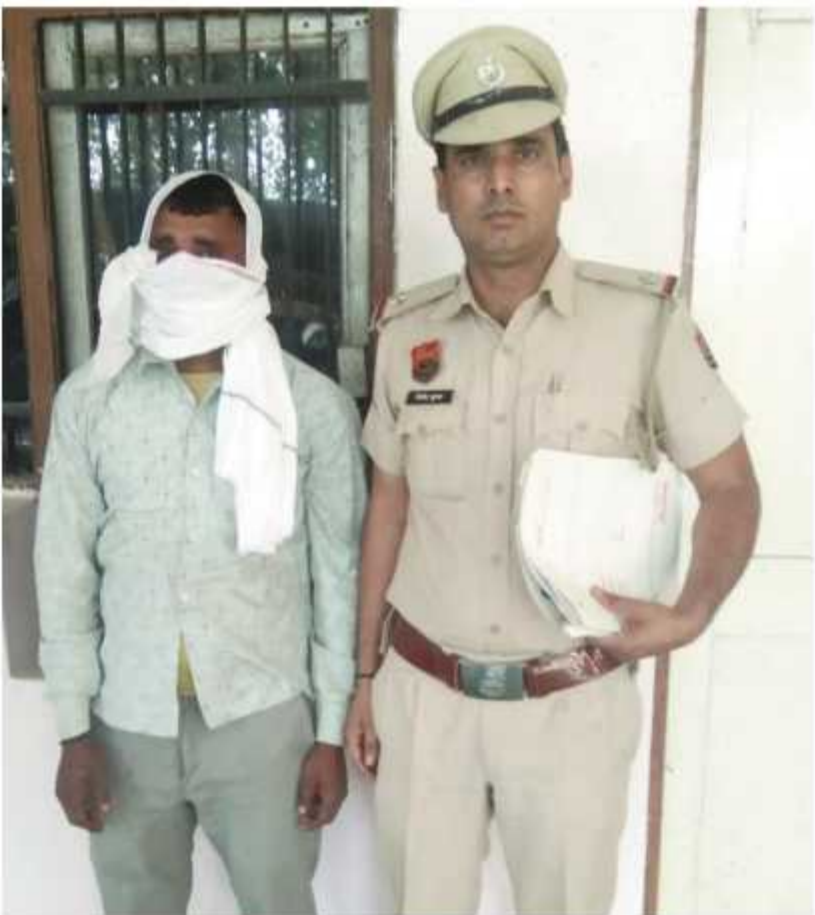
समाचार गेट/निकिता माधोगड़िया रेवाड़ी। बस स्टैंड चौकी पुलिस ने महिला के

बैग से जेवरात व नकदी चोरी करने मामले में तीन साल से फरार एक और आरोपी को गिरफ्तार