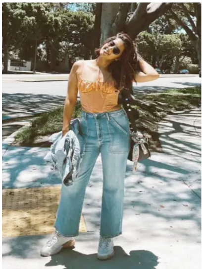
क्रॉप स्ट्रेट लेग जींस

बैगी जींस को ऐसे करें स्टाइल आजकल ज्यादातर लड़कियों के पास बैगी जींस हैं, जो एकदम फंकी लुक देती हैं। इस तरह की जींस को आप शर्ट या टी शर्ट के साथ टक करके या फिर क्रॉप टॉप से साथ भी स्टाइल कर सकती हैं। आप इसके साथ ओवर साइज टीशर्ट भी कैरी कर सकती हैं।