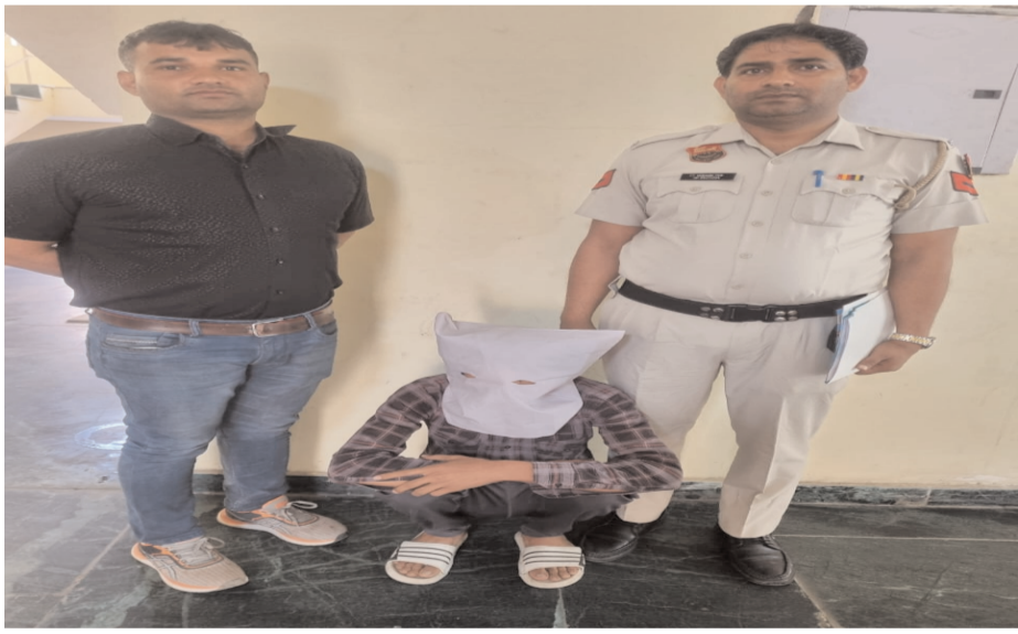
कि अवैध हथियार धारकों के खिलाफ यह अभियान लगातार जारी रहेगा।